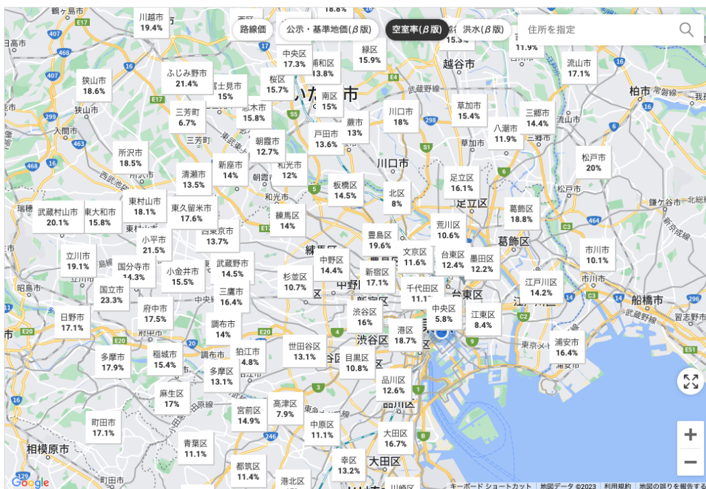
パソコン画面では、空室率を一度に100個表示できる

画面に表示できる空室率は、アプリ版だと20個でしたが、Web版では100個まで表示することができます。賃貸経営では、空室が増えるほど家賃収入が減少します。物件購入後の稼働率を高めるためには、エリアの空室率は重要な判断指標の1つとなります。今回のアップデートで、大きな画面で複数エリアの同時比較が可能となり、迅速な投資判断に役立てていただけます。