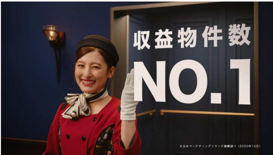
「町ではなく待」篇から