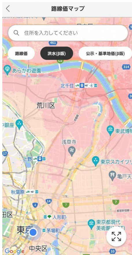
【洪水ハザードマップ】