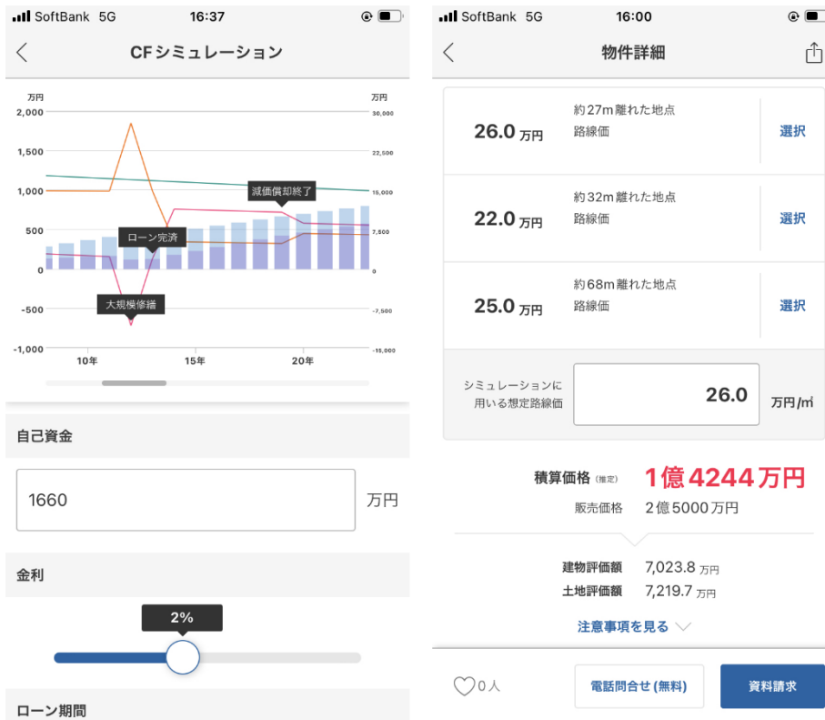
左からキャッシュフローシミュレーション、積算価格シミュレーションの操作画面

「キャッシュフローシミュレーション」は、収益物件を購入した場合、いくら手元に残るかを50年後までシミュレーションできる機能です。シミュレーションしたい物件を選ぶと、デフォルトで設定された数値を元に、自動計算されたシミュレーションが表示されます。楽待に掲載されていない物件でもシミュレーションは可能です。