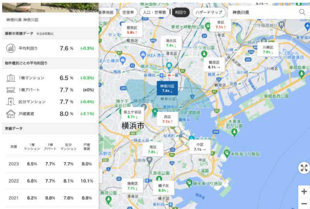
「賃貸経営マップ」の利用画面

国内最大の不動産投資プラットフォーム「楽待」 ( https://www.rakumachi.jp/ ) を運営する株式会社ファーストロジック（本社：東京都中央区、東証スタンダード上場、証券コード：6037）は、「平均利回り」の過去データを確認できる新機能をリリースいたします。